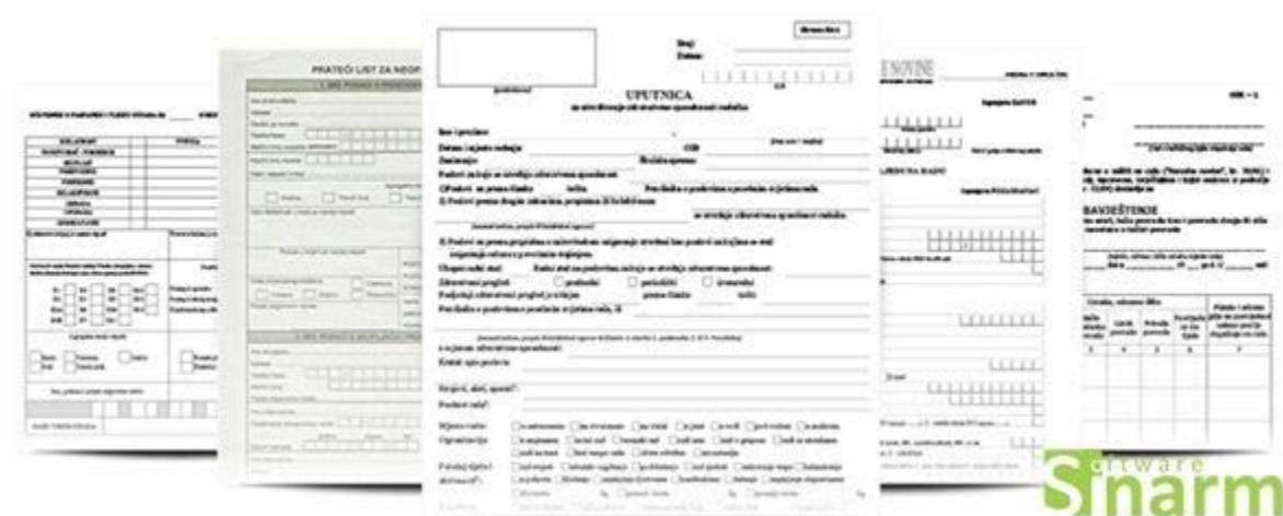
Slika 1 - Prikaz evidencijskih obrazaca

Važno je naglasiti da je Sinarm jedino programsko rješenje koje omogućava korisniku vođenje svih potrebnih evidencija iz područja ZNR ZOP i ZO na jednom mjestu uz mogućnost prilaganja vanjskih dokumenata (uvjerenja, svjedodžbe i slično). Dizajniran je tako da zadovoljava potrebe malih poduzetnika za jednostavnošću, ali se može koristiti i u velikim tvrtkama u kojima istovremeno radi veći broj korisnika. Iznimno je korisno što Sinarm pruža mogućnost kreiranja personaliziranih izvještaja , pri čemu korisnik sam odabire, grupira i sortira podatke za izvještaj. Treba istaknuti da je u program moguće integrirati korisnikove postojeće digitalne podatke ili izraditi modul za povezivanje s kadrovskom evidencijom.